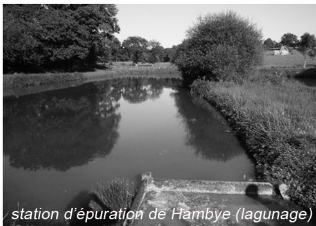
station d'épuration de Hambye (lagunage)

Nous nous sommes ensuite rendus dans plusieurs stations d'épuration (lagunage naturel à Saussey et Hambye, lagunage à «macrophytes» à Ste-Honorine-la-Guillaume, station d'épuration de Quettreville-sur-Sienne), afin de connaître les différents procédés, leurs coûts, ainsi que leurs contraintes.